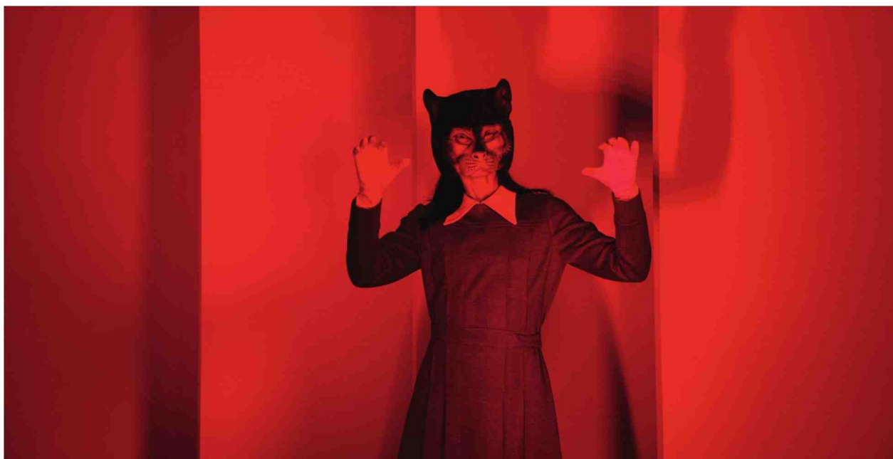
In de video 'Sideshow' verschijnen en verdwijnen allerlei figuren. © Ana Torfs