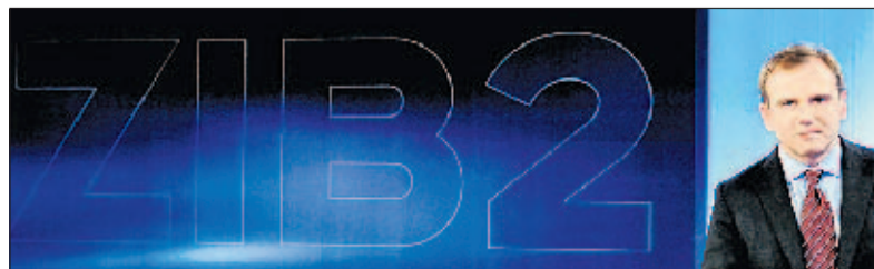
Chefredakteur bedeutete Abschied von „ZiB 2“: Armin Wolf.